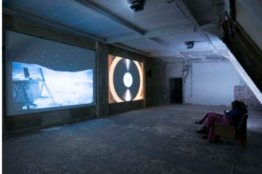
Soda_Jerk: Astro Black